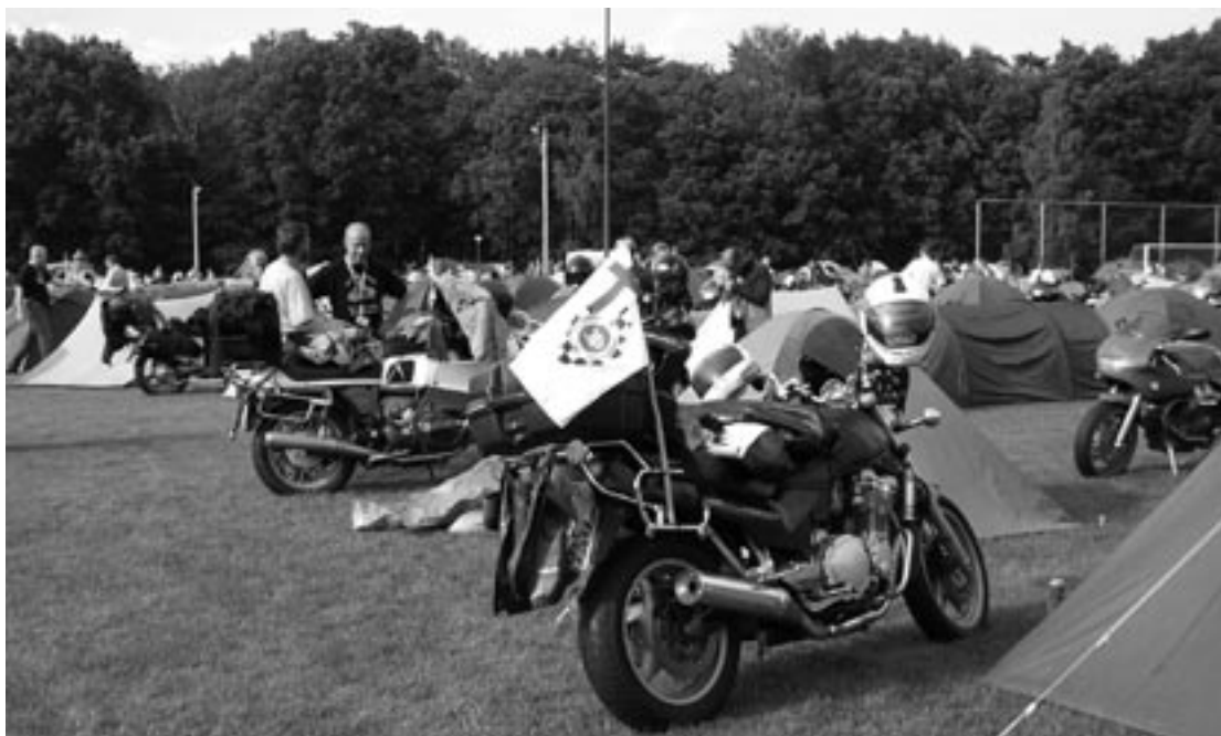
Yleisin majoitusmuoto matkamotoristeilla on telttailu

Viime vuosina kerholaisia houkuttelevia kokoontumisajoja ei FIM-Rallin lisäksi ole oikeastaan ollut kuin Jögeva-treff Viron Kuremaalla ja Sudenajo Lieksassa. Mutta muuten TeMK:n väki kyllä kiertää kaikenlaisia tapahtumia milloin omalla porukalla ja milloin muiden kanssa. Joskus lähdetään jopa Keski-Eurooppaan viikoksi ajelemaan ilman mitään sen tarkempia suunnitelmia paluupäivän lisäksi. Teemana voi olla vaikka sadepilvien väistely.