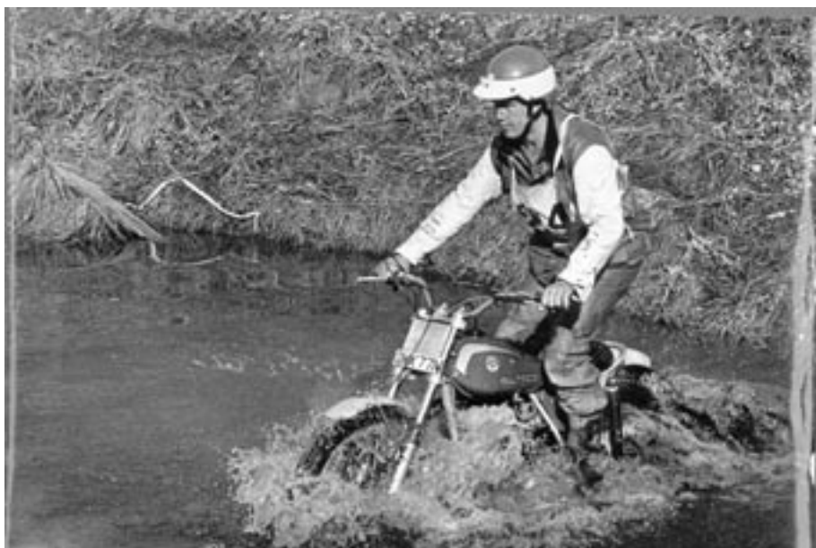
Alan Lampkin Tervajoen ylityksessä 1975 Finn-Trialissa

Kauden aikana järjestettiin kahdet kansallisen tason trial-kilpailut ja yhteensä kymmenen sarjakilpailua. Vuoden kovin juttu oli kuitenkin kunnia olla järjestämässä Finn-Trial MM-osakilpailua yhdessä Helsingin Moottorimieskerhon kanssa. Tapahtumapaikkana oli Kalpalinna, jossa HMMK huolehti lähtö- ja maalipaikasta sekä kolmesta jaksosta. Loput 25 jaksoa oli Tervakosken ympäristössä ja niistä vastasi Tervakosken Moottorikerho. Kilpailu oli suuri voimannäyte pienelle kerholle ja sen kunnialla läpivieminen antoi uskoa järjestää myöhemminä vuosina ne useat arvokilpailut jotka TeMK on järjestänyt.