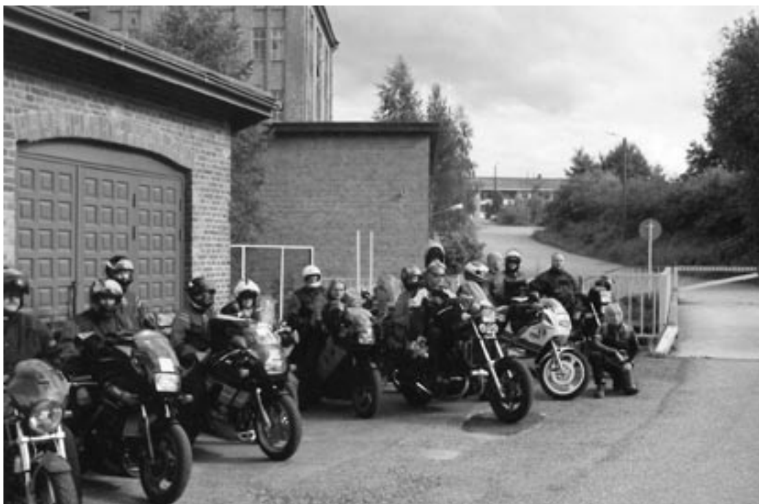
Tervakoskelaisia motoristeja lähdössä Ranskan Epernayhin.

Noista ajoista matkamoottoripyöräilyn suosio on Suomessakin lisääntynyt valtavasti, vähälumisempien kuukausien aikana on mahdollisuus osallistua joka viikonloppu vaikka useampaankin kokoontumisajoon. Suomen kesässä riittää kyllä matkamoottoripyöräili-