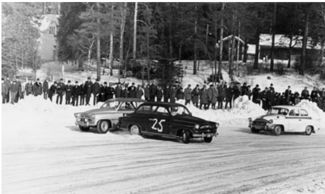
Jäärata-ajot Alasjärven jäällä vetivät paikalle yleensä paljon yleisöä

Alkuvuosina toiminnan pääpaino oli autourheilussa, mutta myös moottoripyöräilijät olivat toiminnassa mukana. Autourheilun piirissä syntyi perinteikäs ja arvostettu ST-kilpailu, Tervaskannon lenkki, joka pian sai SM-osakilpailun arvon. Vuonna 1971 kilpailu muuttui Etelä-Hämeen Kaksoseksi, joka käsitti yhdistettynä edellämaitun sekä Riihimäen UA:n Syyseksytyksen. Tämän suuren kilpailun lisäksi järjestettiin useita muita ST-kilpailuja ja jäärata-ajoja. Autourheilun piirissä järjestettiin myös lukuisia kartanluku- ja moottorikursseja.